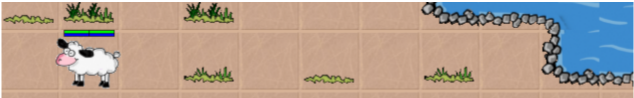
Java Programmieren auf dem Bauernhof