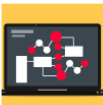
Algorithmen mit Java