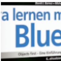
Einstieg in Java mit BlueJ